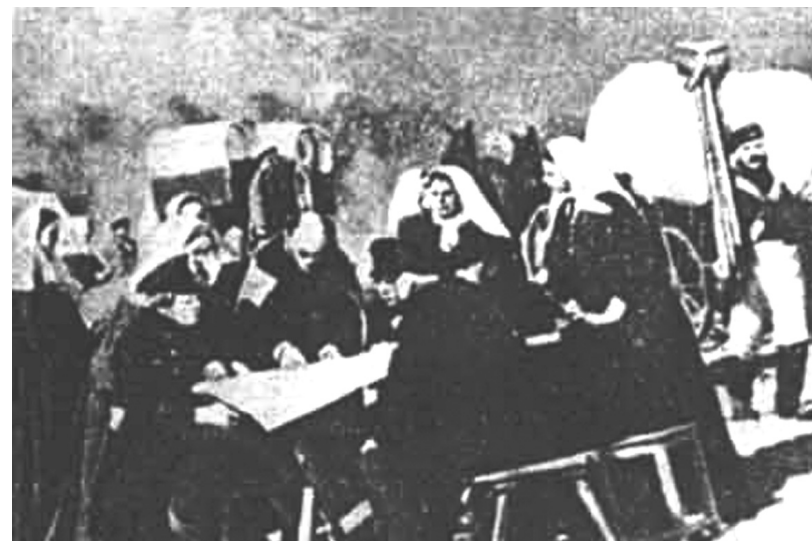
Н.И. Пирогов среди сестер милосердия Крестовоздвиженской общины, 1855 г. (из книги А.В. Воронай. Н.И. Пирогов и краснокрестное движение. М., 1985)