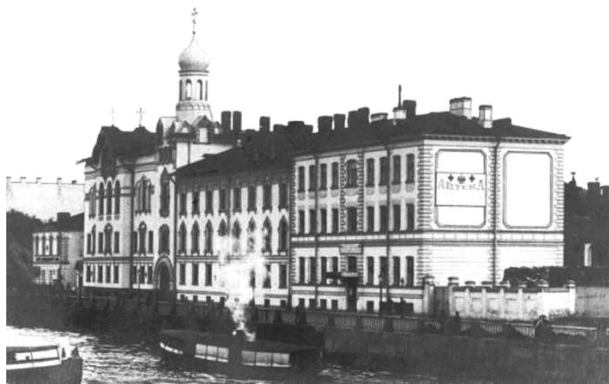
Крестовоздвиженская община сестер милосердия

угощены фрыштуком 5 в особом зале. Так состоялось открытие одной из первых в мире общин сестер милосердия.