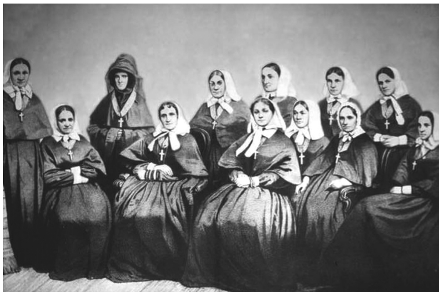
Сестры милосердия Крестовоздвиженской общины времен Крымской войны