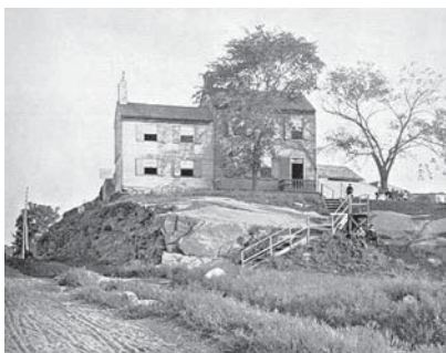
Ферма Бреннан (Brennan farm) в Нью-Йорке, где Э. По написал стихотворение «Ворон».

Из всех мест, в которых он мог бы оказаться, По почему-то выбрал для своей биографии Санкт-Петербург.