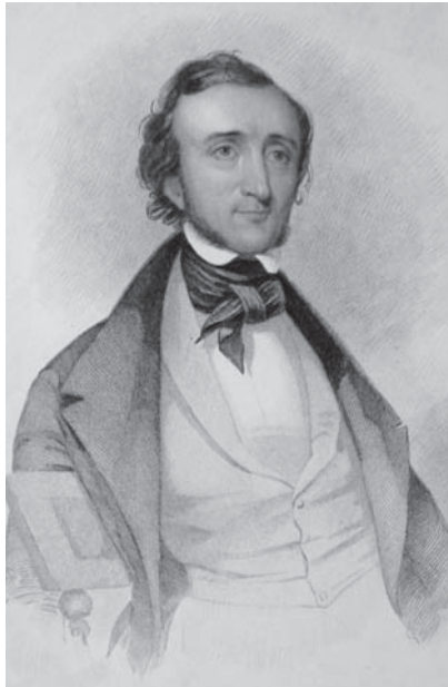
Эдгар По. 1845 г.

Гризуолд придумал пьяный дебош, как он придумал многие подобные эпизоды в своих мемуарах, ставших официальным источником