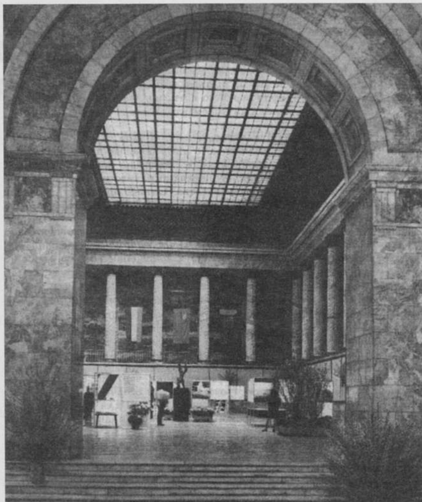
Вход в Памятный зал императора Александра III в Этнографическом музее

Геральдика дома Романовых была в меру и эффектно вкомпонована в архитектурный декор. Хрустальный плафон набран из блоков пирамидальной формы; соединенные, они работали как свод и не требовали дополнительных конструктивных креплений, уменьшающих освещенность зала. Золоченая и патинированная бронза была использована в поддугах, капителях и базах колонн, предусматривалась также в горельефе и золоченых грифонах, стоящих на постаментах у