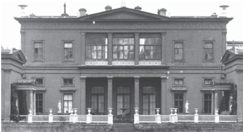
Южный фасад дворца герцога Лейхтенбергского в усадьбе «Сергиевка». Фото 1930-х гг.

Для атрибуции найденных фрагментов левой статуи у южного фасада дворца важно расшифровать и понять содержание подписи