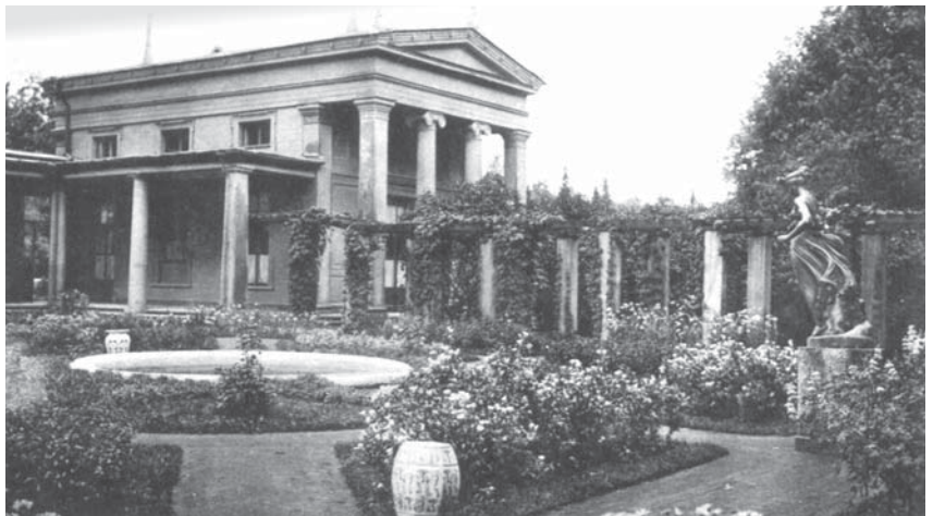
Гальванопластическая копия с мраморного оригинала «Геба» А. Кановы, стоявшая на лужайке дворика у западного фасада дворца. С дореволюционной открытки. Ок. 1907 г.

Многие известные историки искусств начала XIX века неизменно обращали внимание на очевидное соперничество двух величайших