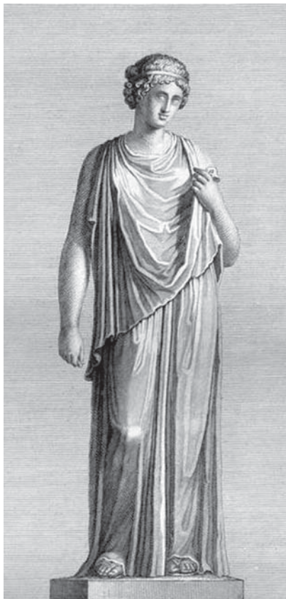
Гравюрное изображение мраморной статуи «Немезида» из материалов музеев Ватикана по Пио Клементино, Каталог Висконти. 1782 г.

В древнегреческой мифологии «Немезида» (Немесиды) – богиня возмездия, мщения, карающая за нарушение общественных и моральных норм, наблюдающая за равным распределением благ среди смертных, воздает людям сообразно их вине наказание за гордыню и несправедливость. Обычно изображалась с атрибутами контроля равновесия в обществе (весы), наказания (меч или плеть) и быстроты возмездия, последнее символизировалось согнутой в локте рукой (в древние века это – синоним неизбежной кары). С расцвета Рима до настоящего времени Немезида является символом юстиции, как богиня, олицетворяющая справедливость и правосудие.