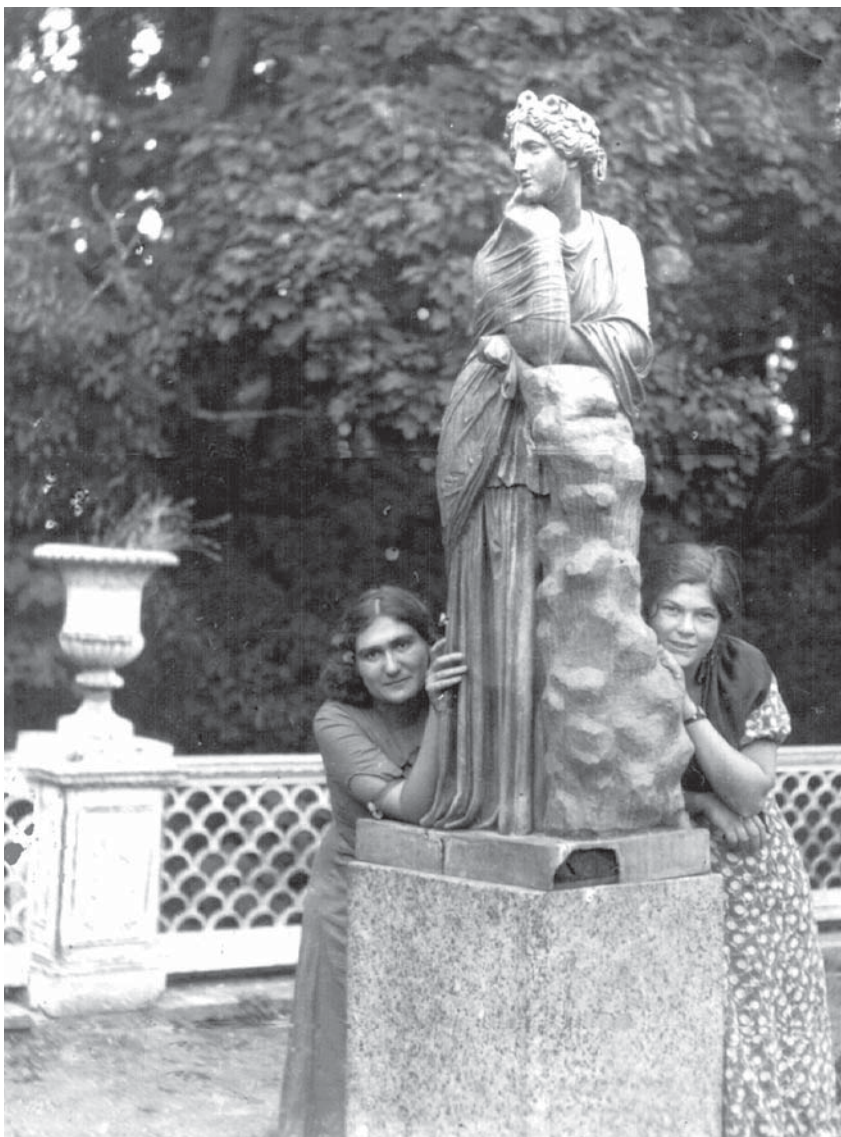
Гипсовая копия музы «Полигимния», стоявшая на лужайке дворика у западного фасада дворца. Фото 1936 г.