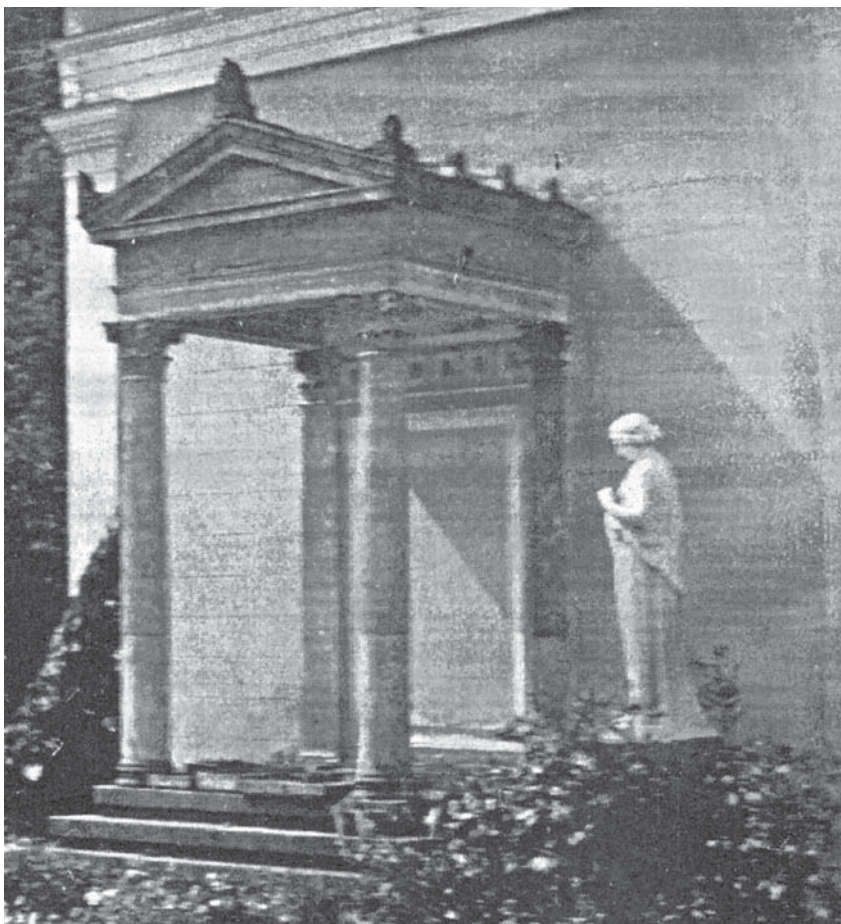
Статуя «Немезида», стоявшая слева у южного фасада дворца. Фото 1930-х гг.

на плинте: F (сокращенное слово Fecit – изготовил), Franchi (Франчи – фамилия известного итальянского мастера, изготавливающего в середине XIX века копии статуй великих греческих и итальянских мастеров), a (сокращенное слово anno – год изготовления 1846), S: (сокращенное слово sculpe – что значит высек), in Carrara (обозначает