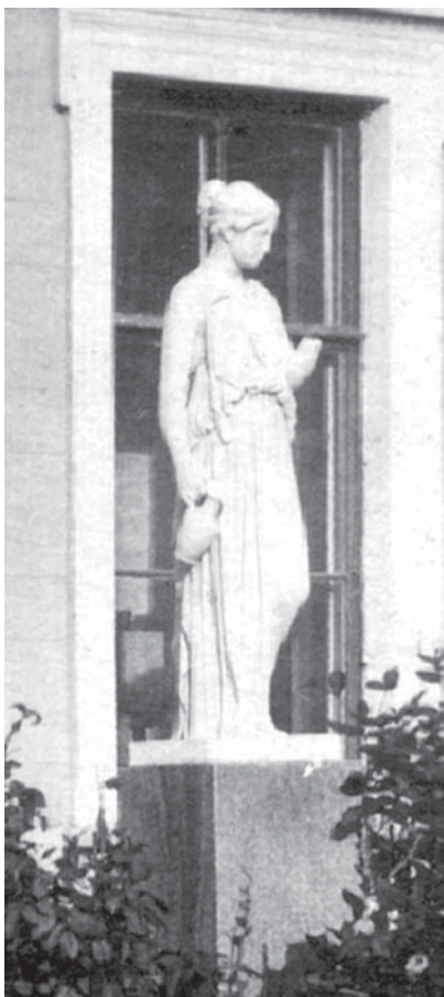
Статуя «Геба», стоявшая справа у южного фасада дворца. Фото 1930-х гг.