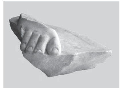
Фрагменты статуи и воссоединенная мраморная статуя «Немезида». Фото 2007 г.

Получив в свое распоряжение изображение высокого качества статуи «Немезида», мы смогли идентифицировать еще один фрагмент мраморной скульптуры – обломок ступни правой ноги с частью плинта. Скол при разрушении статуи произошел как раз по месту соединения спадающих складок пеплоса со ступней.