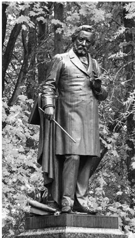
Памятник М. И. Глинке в Смоленске. Бронза, гранит. Открыт в 1885 году Архитектор И. С. Богомолов

в настоящее время экспонируются в Русском музее, а местонахождение других не установлено.