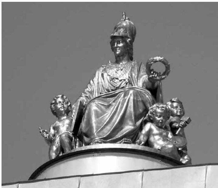
Минерва. Группа на куполе здания Академии художеств Бронза. Воссоздана и установлена в 2003 году