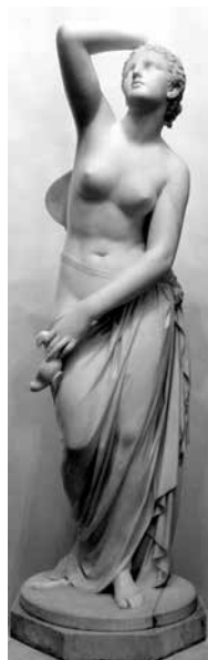
Психея. Статуя Мрамор. 1864. ГРМ

академика. Надо обратить особое внимание на этот факт, так как Совет Академии художеств редко нарушал правила, предусмотренные уставом.