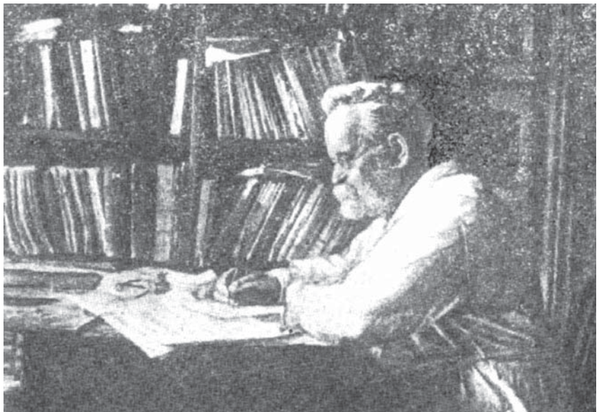
Н. А. Морозов в своем летнем рабочем кабинете в Борках. Фото 1939 г.

С Н. А. Морозовым литератор и сценарист нашли общий язык быстро, миром кино Морозов, как выяснилось, увлекался (чем только не интересовался этот Ломоносов и Леонардо да Винчи XIX–XX веков!), а чисто по-житейски он оказался очень покладистым, дружелюбным человеком, очень гостеприимным и даже хлебосольным хозяином. Напомню, что время съемок было нелегким – еще не были отменены карточки, но к приходу съемочной группы на квартиру к Морозову стол уже ломился от такого изобилия съестного, что, как с юмором вспоминал отец, «все наши от увиденного лишились дара речи и чуть не попадали в голодные обмороки!» Заприметив некое замешатель-