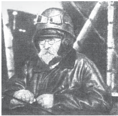
Н. А. Морозов – авиатор

...Когда вы будете проходить по улице Союза Печатников, обратите, пожалуйста, внимание на мемориальную доску на доме 25а: «Здесь жил и работал с 1906 по 1941 год революционер и ученый, почетный академик Николай Александрович Морозов (1854–1946)».