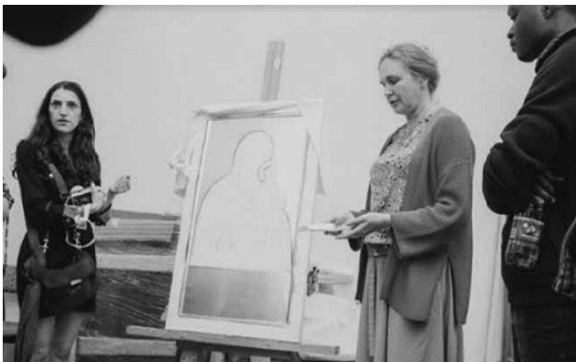
Посещение волонтерами иконописной мастерской лавры

архитектурного комплекса монастыря и с особенностями русской церковной архитектуры; осмотрели подлинные церковные древности; получили знания об особенностях использования исторического архитектурного комплекса для современных нужд; поняли специфику приспособления исторического здания под функционал действующего православного монастыря; познакомились с исполнением программы социальной деятельности Русской Православной Церкви в деле сохранения нематериального культурного наследия.