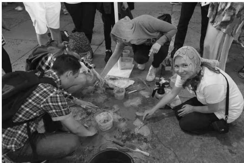
Мастер-класс по строительным технологиям

провела для объединенной волонтерской команды лагеря ЮНЕСКО и школы ИКОМОС мастер-класс по промывке и очистке скульптуры. На примере надгробных памятников, изготовленных из разных горных пород (известняк, красный гранит, габбро-диабаз, песчаник), на «Некрополе Архимандритов» специалист при помощи профессионального оборудования показала методику очистки каменной скульптуры. В ходе мастер-класса участники познакомились с алгоритмом проведения промывки и очистки каменных надгробий, узнали о важности фотофиксации (до, в процессе и после очистки) и о том, какие химические средства допустимо использовать для работ с памятниками, выполненными из камня. По окончании мастер-класса с помощью волонтеров было очищено шесть надгробных памятников XIX века, находящихся перед музейно-библиотечным корпусом лавры.