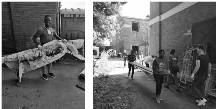
Уборка волонтерами внутренних дворов хлебных амбаров

охраняемых территориях, познакомились на практике с принципами сбора, сохранения и сортировки артефактов, научились выявлять признаки угроз деревянным конструкциям при эксплуатации памятника и получили опыт применения эффективных практик, соответствующих действующему законодательству. В результате было достигнуто распространение положительного опыта применения методов и способов сохранения и использования исторических объектов для современных нужд религиозных организаций на примере работ в архитектурном комплексе Александро-Невской лавры.