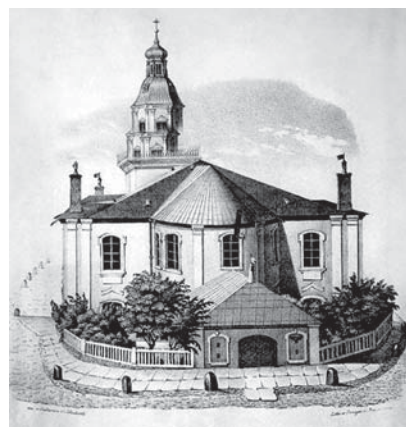
Первая евангелическо-лютеранская церковь апостола Петра на Невском проспекте. Литография по рис. Г. Шуберта. Дразгер и Беркманн, литографская мастерская

26 августа 1757 года Левин Фабиан обвенчался с голландской Софией Шарлоттой Борст