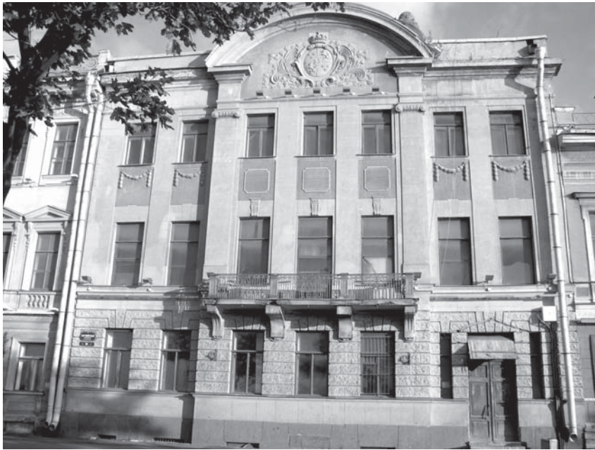
Дом Бётлинга на Английской наб., 64.