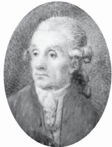
Логин Петрович (Левин Фабиан) Бётлинг.

Петербурге. Современные адреса этих домов – Английская набережная, 16, 26, 42, 66, Почтамтская улица, 16 (Большая Морская улица, 59), а также особняк, стоявший на месте дома № 68 по Английской набережной и дом в Литейной части на углу Гагаринской улицы и Дементьева переулка (ныне улица Оружейника Федорова) 13 . В записках И. Г. Георги 1790-х годов мы находим описание и загородного дома Бётлингов по Петергофской Большой дороге. «Дачи Статской Советницы Убри и купца Бётлинга на 2 версты суть на две части разделенное место, каждая по правой стороне дороги на 50 сажен поперешнику и простираются, так как и все следующие от правой стороны дороги до залива. Обе имеют деревянные загородные дома и перед оными увеселительный и