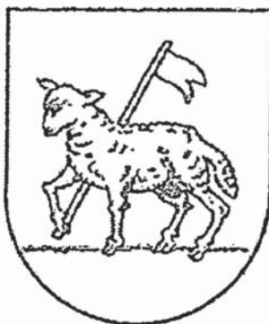
Первоначальный герб рода Бетлинг (любекский период). (Nederland's Patriciaat)