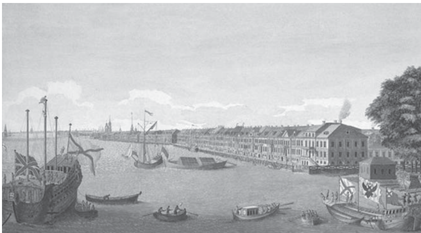
Вид вверх по Неве-реке к востоку между Галерной верфью и 13-й линией Васильевского острова. 1750–1753. По рисунку М. И. Махаева. Справа – панорама Английской набережной