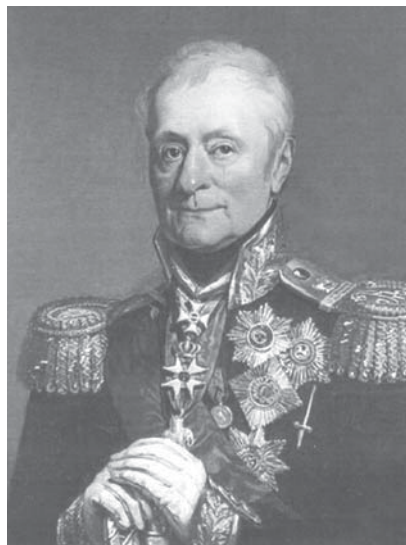
А. Беннигсен, портрет в Галерее 1812 г. Эрмитаж

Однажды, прогуливаясь по городу, я увидела афишу фестиваля классической музыки, в программе которого стояли произведения Чайковского, Моцарта, Шуберта, Брамса. Концерты проходили под