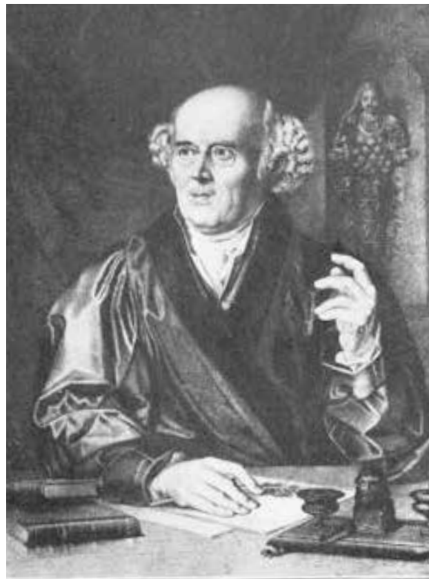
С.Ганеман, основоположник гомеопатии