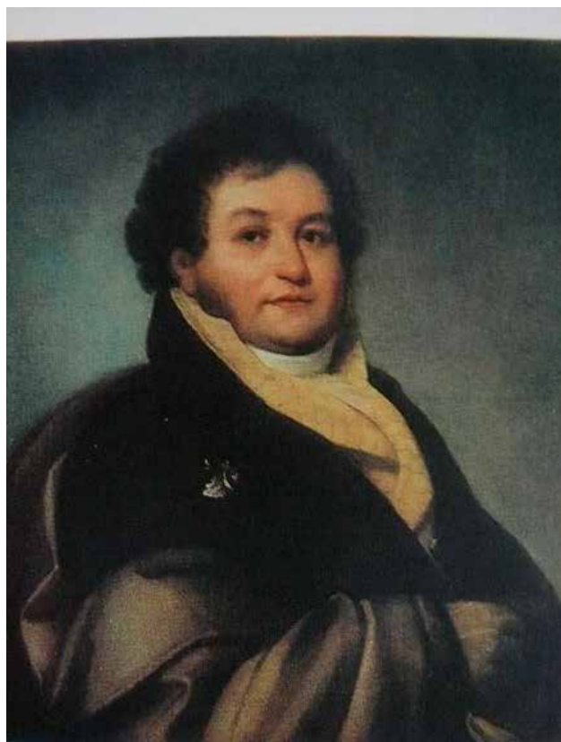
Орест Адамович Кипренский 1782—1836 Портрет Ю. П. Литты. 1813

Подводя итог, фон Клоссе заключил, что в проекте Пешеля «видны только необдуманное предположение, не только без хозяйственных, но и без всяких расчетов» и «учреждение подобно-предполагаемой аптеки ... влечет за собою один только вред» 17 как для общества, так и для него.