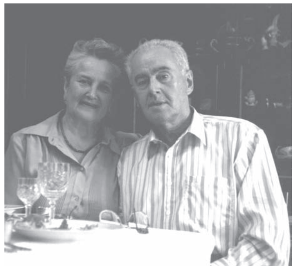
43 года спустя (2001 г.)