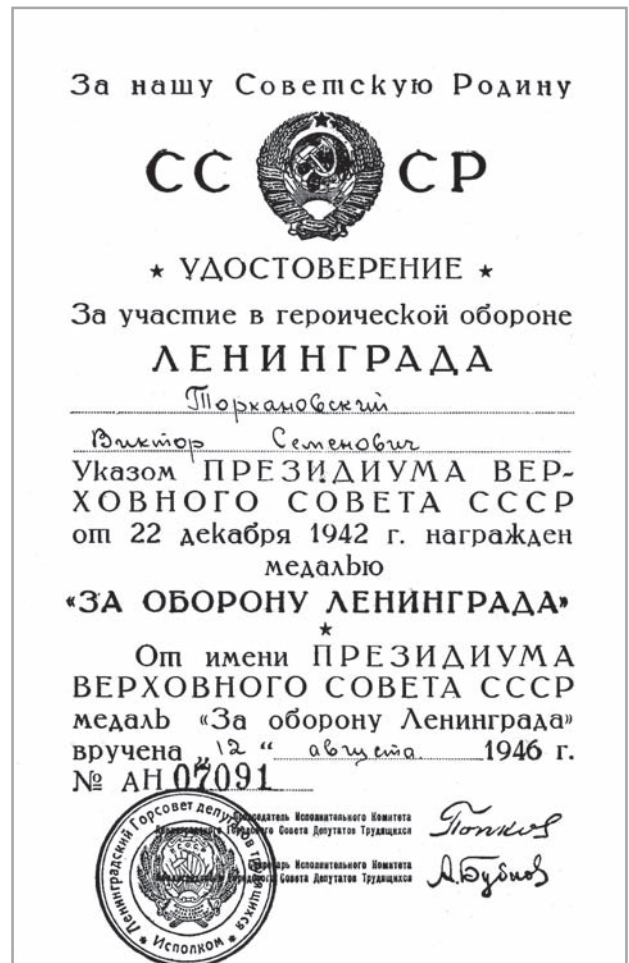
Удостоверение о награждении медалью «За оборону Ленинграда»