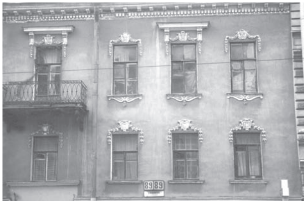
Фрагмент фасада дома по ул. Садовой, 89; техн. М. А. Андреев. 2002 г.