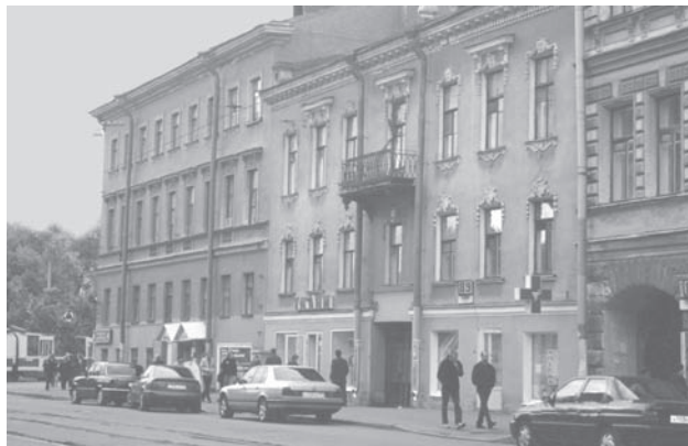
Фасад дома по ул. Садовой, 89. Фото З. Л. Когодовской. 2002 г.

доме по Садовой Лисянский прожил с лета 1835 года до кончины в феврале 1837 года.