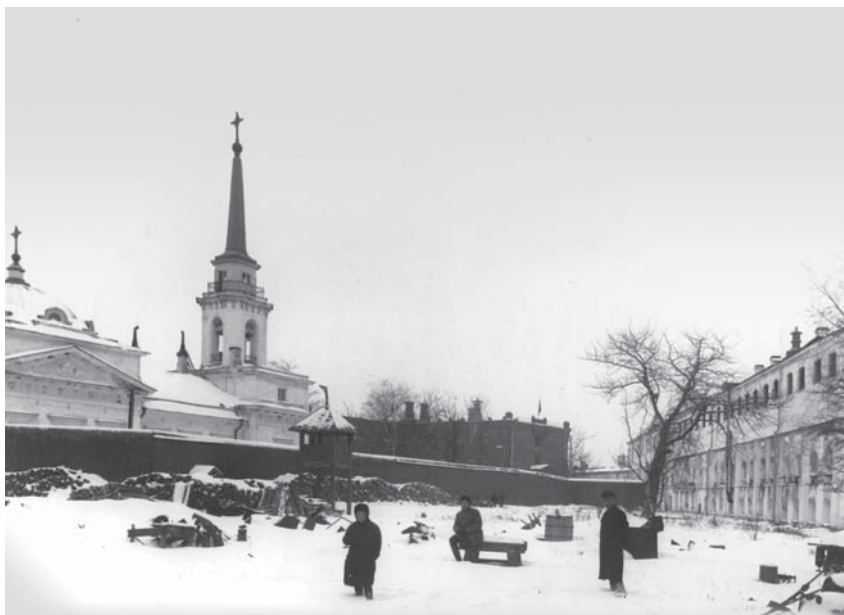
Шлиссельбургская крепость после освобождения заключённых. Март 1917 г.

ца, а в первом и во втором этажах было оборудовано восемь общих тюремных камер. Так возник первый тюремный корпус, который заключенные называли «зверинцем». Это название объяснялось особым устройством общих камер, которые были отделены от коридора не обычной стеной, а железной решеткой от пола до потолка. Каждая камера была рассчитана на 15 заключенных. Внутреннее устройство всех камер было одинаковое: 15 откидных коек, две доски, прикрепленные к решетке, заменявшие стол. В углу камеры стоял открытый шкафчик для хранения хлеба. Восемь камер занимали среднюю часть «зверинца», в той части здания, которая примыкала к Светличной башне, находились мастерские: кузнечная, слесарная и ткацкая; – в противоположном конце здания, у Государевой башни был изолятор для психических больных и церковь. В 1907–1908 годах была перестроена Старая тюрьма. Старые стены были разобраны, и на прежнем фундаменте было построено новое двухэтажное здание с 12 общими камерами, по шесть в каждом этаже. В каждой камере было по два окна. Окна камер выходили на большой двор цитадели, а окна коридора – на малый двор. Перестроенный из Старой тюрьмы второй тюремный корпус заключенные называли «Сахалином». Название это было очень удачным, так как метко отражало основное