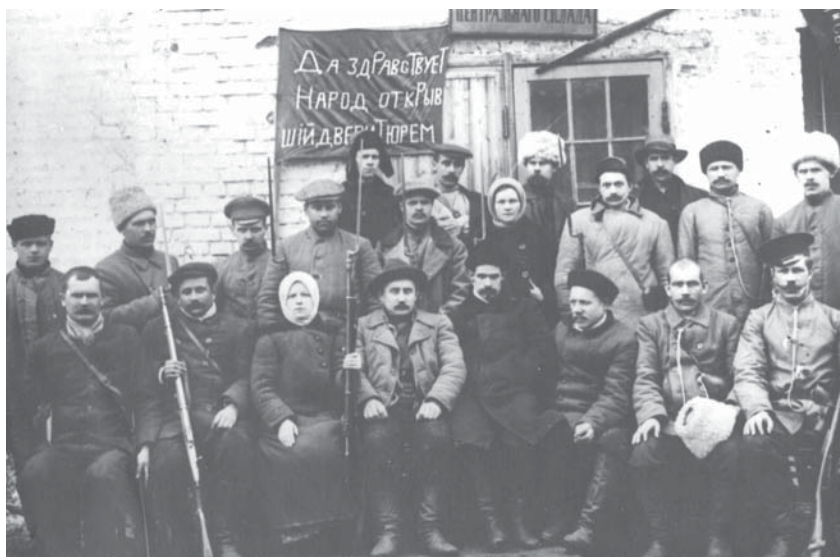
Группа освобождённых узников крепости и рабочих порохового завода. 1917 г.