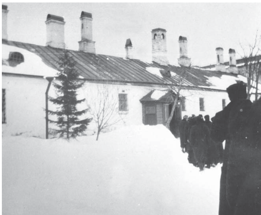
Шлиссельбургская крепость. Группа посетителей у Старой тюрьмы. 1906 г.

первые экскурсии были проведены в крепости более 100 лет тому назад. Но уже летом 1906 года доступ на остров был запрещен. С первых месяцев 1907 года началось создание каторжной тюрьмы в Шлиссельбургской крепости. Старая солдатская казарма, построенная еще в 1728 году, была перестроена, над нею был возведен третий этаж, где разместилась тюремная больница.