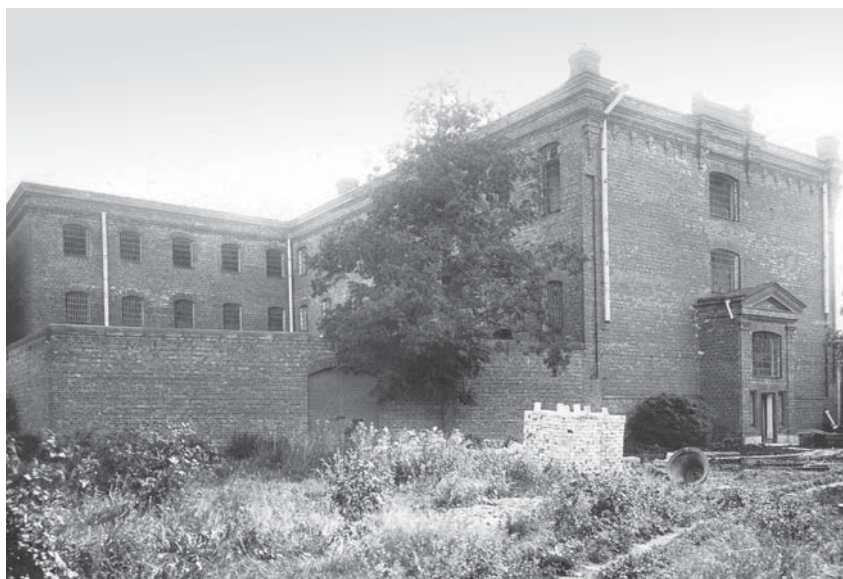
Шлиссельбургская крепость. Четвёртый тюремный корпус после освобождения заключённых. 1917 г.

Политкаторжане Шлиссельбурга 1907–1917 годов вспоминали о карцерах, которые администрация тюрьмы часто использовала для наказания узников за любые провинности: за то, что не встал при проверке, не снял шапку перед начальством, за пение и слушание пения, за передачу записки другому заключенному, за перестукивание, за оскорбление надзирателя и за многое другое. Карцеры были свет-