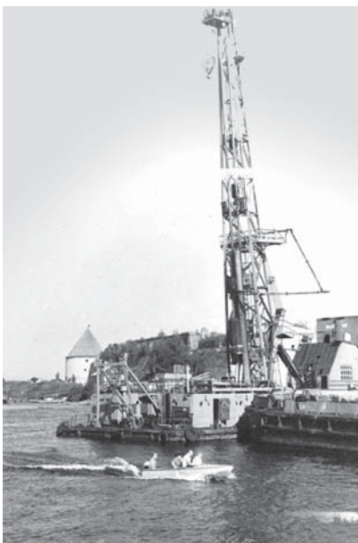
Шлиссельбургская крепость. Строительство пассажирского причала. 1967 г.

К открытию музея в крепости Орешек 10 июня 1965 г. на острове были оборудованы два временных причала для приема экскурсионных теплоходов. В 1965 году, в течение экскурсионного сезона, крепость посетили 40 250 человек, прибывших на 200 теплоходах, в 1966 году – 57 580 человек (370 теплоходов), в 1967 году – 70 374 человека (378 теплоходов). В последующие годы посещаемость музея увеличивалась до 85 000 человек, с 1991 года наступил резкий спад, в 2007–2009 годах