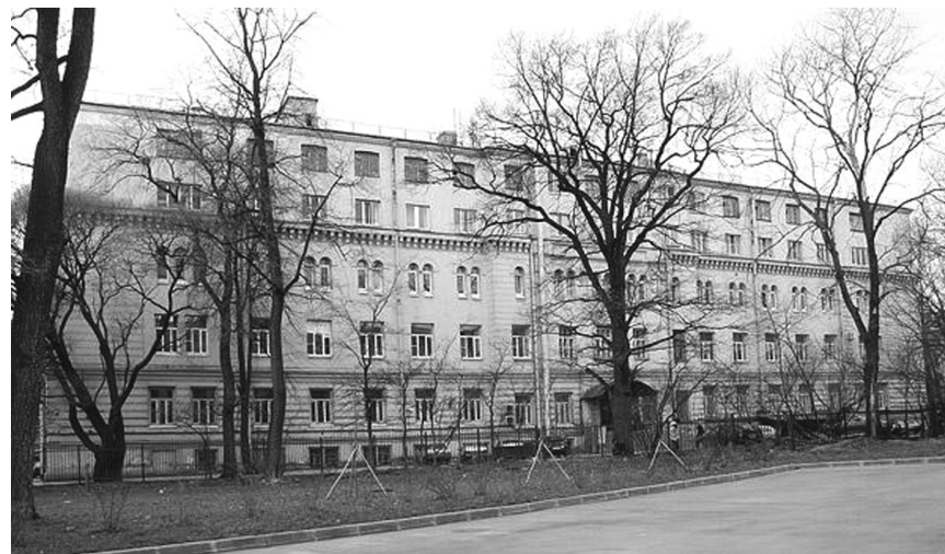
Здание Областной клинической больницы на ул. Комсомола, 6

Перед библиотекой стояла задача – обеспечить каждого медицинского работника областного здравоохранения необходимой литературой. Широкое распространение получили передвижные библиотеки, почтовый абонемент, заочный абонемент, пункты выдачи. По приказу Министерства здравоохранения РСФСР, в 1949 году началась работа