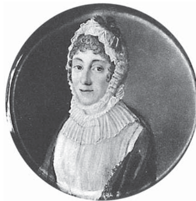
Графиня Анна Логгиновна Ламбдорф (урожд. Бётлинг). Из сборника «Русские портреты XVIII и XIX столетий». В 5 т. Т. 3. Вып. 4. СПб., 1907 г.

Фридрих (Фредерик, Friedrich (нем.), Fredrik (гол.), 10.06.1766–21.02.1811, Амстердам). Торговый агент российского императора в Голландии 44 . Родоначалник голландской ветви Бётлингов. Сохранился любопытный документ эпохи наполеоновских завоеваний – «Инструкция [посланника в Гааге Г. О. Штакельберга] торговому агенту в Амстердаме Бётлингу», составленная в октябре 1804 года, в которой российскому представителю поручалось, соблюдая «при том тщательнейшую и величайшую осмотрительность и осторожность», давать голландским жителям уверения: «1) Что ежели Россия и вступит в войны с Франциею, то главною ея целию всегда будут не выгоды какиелибо собственные, но единственно защита слабых и восстановление равновесия в Европе, изпроверженного насиллями французского правительства; 2) Что государь император,