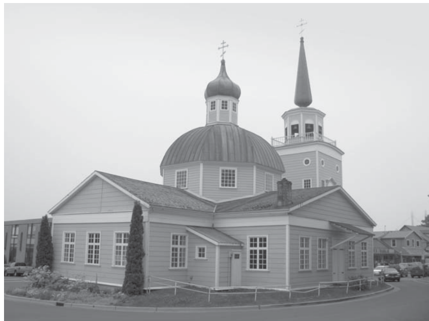
Собор Св. Михаила в Ситхе (бывший Ново-Архангельск)