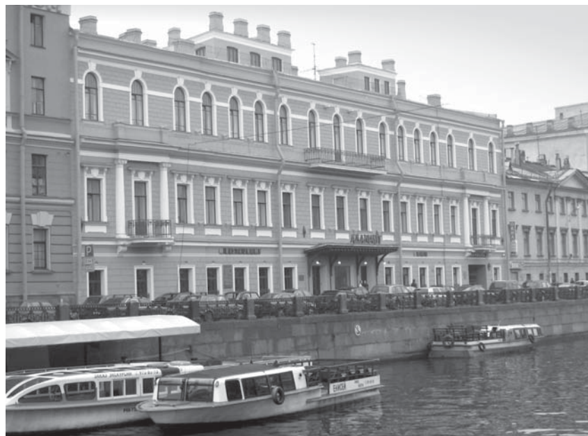
Здание Главного правления РАК в Санкт-Петербурге.

С другой стороны, стоит обратить внимание на представителей столичной науки, которые занимались изучением заморских территорий России. Среди них назовем препаратора Зоологического музея Петербургской Академии наук, натуралиста и коллекционера Илью Гавриловича Вознесенского