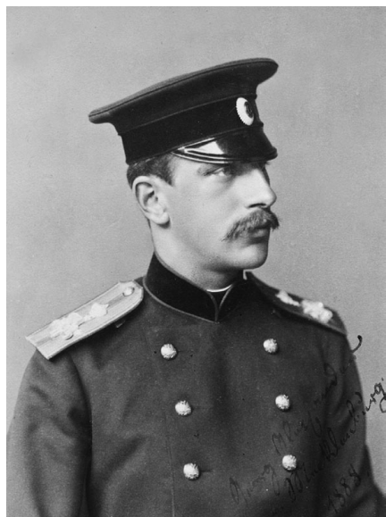
Герцог Г. Г. Мекленбург-Стрелицкий. 1888 г.

В 1895 году герцог Георгий Георгиевич Мекленбург-Стрелицкий приобрел дом на Фонтанке, 46. К этому времени он успешно продвигался по службе в Конногренадерском полку; добившись разрешения на морганатический брак, счастливо женился по любви, у него росли три дочери. Супруга герцога Мекленбургского, графиня Наталия Федоровна Карлова, разделяла интересы мужа, поддерживала идею создания частного квартета и превращения их дома в один из музыкальных центров Петербурга. Но еще полтора года после покупки особняка на Фонтанке семья герцога