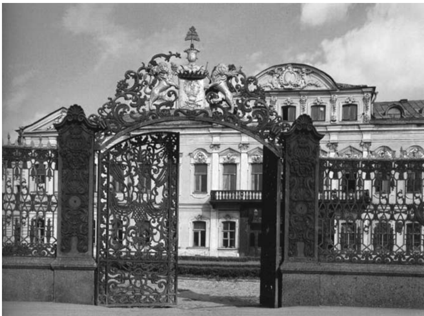
Решетка Шереметевского дворца. 1837–1838 гг.

газета” – созданы во вкусе графа Растрелли. Многие украшения, употребляемые этим великим зодчим, перенесены сюда целиком, отчего эта решётка получила решительный характер, согласный со зданием и временем его построения, и отнюдь от того не перестала быть оригинальною».