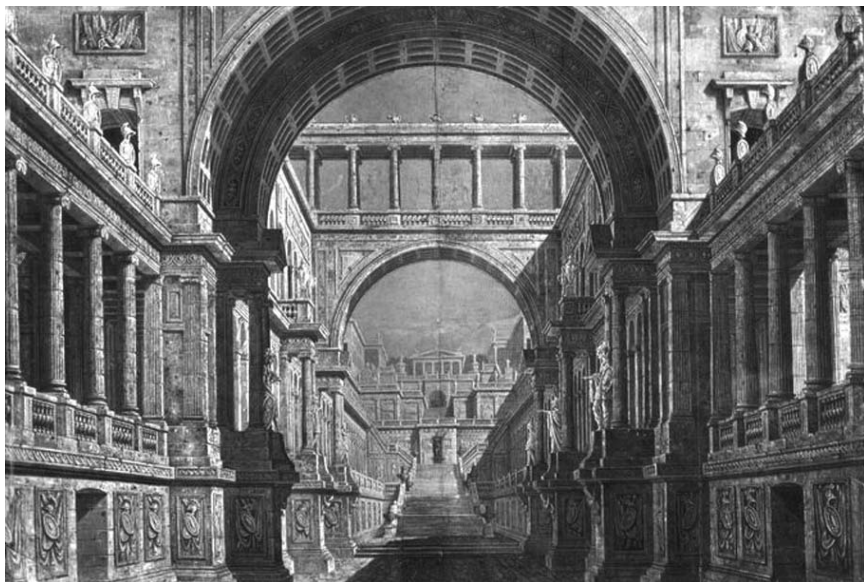
Эскиз декорации к балету «Сандрильона». Совместно с П. Гонзага

академики вместе с Б. Медичи и Ф. Торричелли. В том же году на академической выставке он показал «два внутренних перспективных вида», что говорит о нём как станковом художнике 5 .