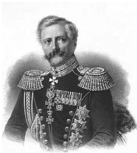
Карл Андреевич Шильдер

В петербургских музеях хранятся портреты Шильдера, макеты изобретений, принадлежавшие ему вещи. В энциклопедиях и справочниках легко найти биографию генерала, которая почти всегда заканчивается характеристикой, данной ему Николаем I: «...такого второго не будет и по знанию, и по храбрости» [8, с. 5].