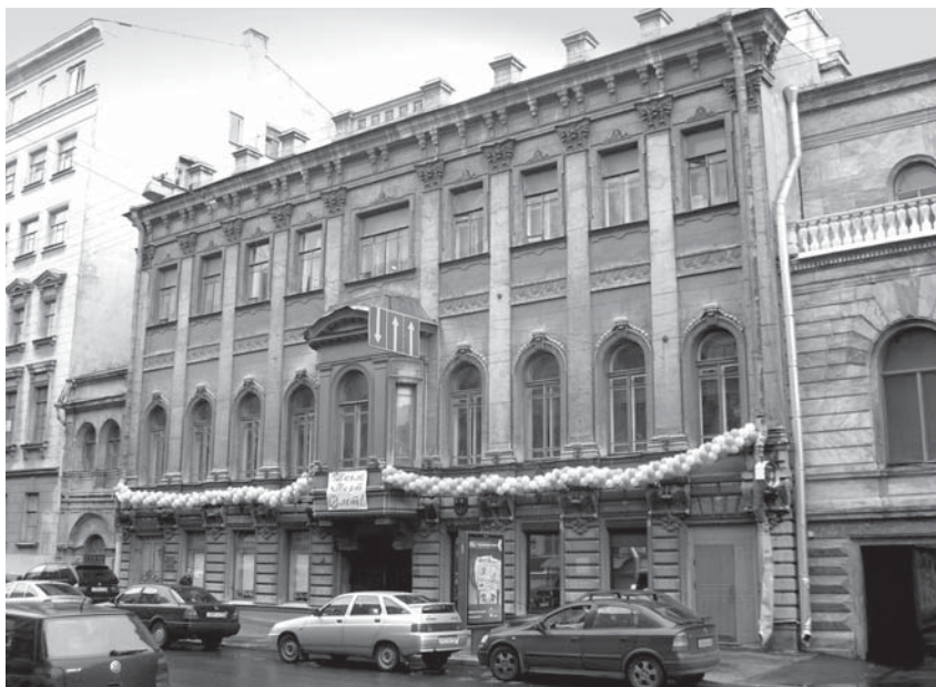
Дом на Гагаринской улице, № 5, в бельэтаже которого в 1861–1862 гг. располагалась дипломатическая миссия США и апартаменты американских дипломатов.

экипажи под гардиробы и для при- слуги». Парадный «кортеж следо- вал по Английской набережной, Исаакиевской и Адмиралтейской площадям, мимо Зимнего Дворца по набережной, к Запасному Дворцу, назначенному для помещения их». А «впереди карет, ехали в коляске, запряженной в 4-е лошади два Япон- ских Офицера с ящиками в которых заключалась грамота и казна» 53 . 2 августа на основе особого «Высо- чайше утвержденного церемониала» состоялся торжественный прием японского посольства императором, который по этому случаю прибыл из Петергофа в Зимний дворец 54 . На протяжении августа 1862 года в Санкт-Петербурге проходили русско- японские переговоры о разграниче- нии на Сахалине и других спорных проблемах, но стороны не смогли тогда достичь взаимопонимания 55 .