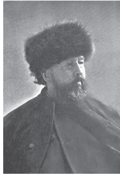
Бейард Тейлор в своем «русском» костюме. Фото 1864 г.

На должность секретаря миссии Камерон пригласил другого уроженца Пенсильвании, известного писа-