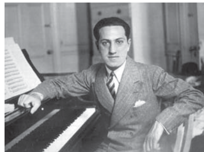
Дж. Гершвин. 1930-е гг.

Джордж много работал, находя вдохновение в многочисленных романах: с актрисой Полетт Годдар 6 (в которую он был так влюблен, что умолял бросить мужа, а им был Чарли Чаплин), с французской кинозвездой Симон 7 . Но главной в его жизни оставалась музыка. Появлялись новые сочинения, среди которых – «Американец в Париже» («An American in Paris»), «Забавная мордашка» («Funny face») – по обоим этим произведениям созданы кинофильмы. И, наконец, одно из самых знаменитых произведений – опера «Порги и Бесс» («Porgy and Bess») по одноименной пьесе Дю Боса Хейворда 8 .