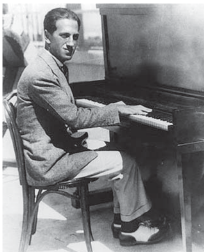
Дж. Гершвин у фортепиано. 1920-е гг.

ка Розенцвейга. На всю жизнь он запомнил свой восторг от Юморески Дворжака 2 и то, как после концерта не один час ждал скрипача под проливным дождем, пока не узнал, что Марк ушел домой через другой выход. Не растерявшись, Джордж пошел к нему домой и настоял на знакомстве.