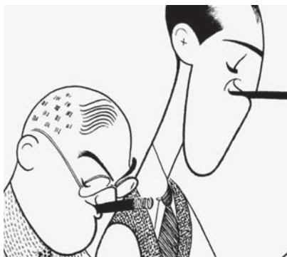
Айра и Джордж Гершвины. Шарж А. Гиршфельда

Но однажды, именно в школе, Джордж услышал игру юного Мар-