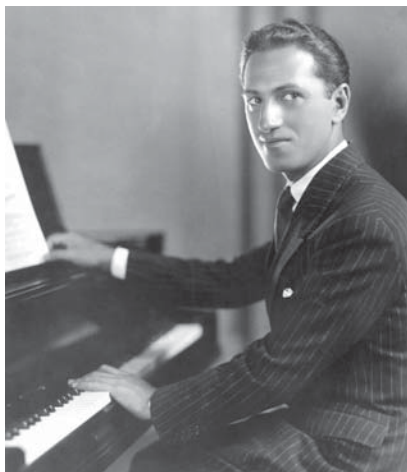
Дж. Гершвин – автор Рапсодии в блюзовых тонах. 1920-е гг.

Дружба с Марком Розенцвейгом (сценическое имя Макс Розен) сыграла большую роль в музыкальном развитии Джорджа, но не потому, что Марк помог ему. Хотя они проводили много времени вместе, слушая музыку, играя вместе и порознь (Джордж уже неплохо владел фортепиано), Розенцвейг решил, что его приятель не имеет способностей к музыке, и искренне сказал ему об этом. Но Джордж не поверил ему – он уже любил музыку так сильно, что никто не смог бы его убедить отказаться от нее.