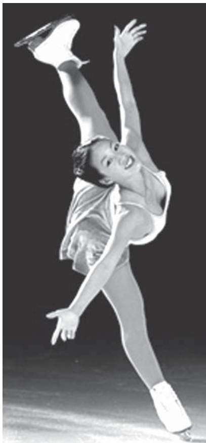
Мишель Кван, серебряный призер XVIII Олимпийских зимних игр 1998 года в Нагано, пятикратная чемпионка мира