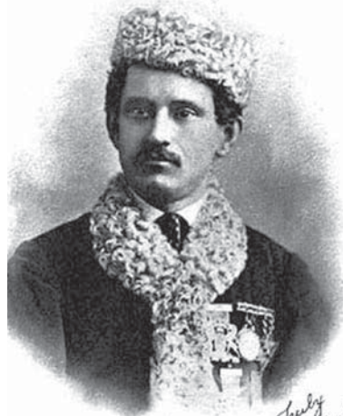
Джексон Гейнц, основатель международного стиля фигурного катания на коньках. 1867 г.

Фигурное катание на коньках имеет богатую историю. Этот вид спорта обрел последователей и поклонников в России еще во второй половине XIX века, когда произошло его становление. Существует несколько вех отечественного развития фигурного катания: открытие в 1865 году первого в России катка на прудах Юсупова сада 1 в Санкт-Петербурге; выступление в 1883 году столичных спортсменов в Международном конкурсе в Гельсингфорсе (ныне – г. Хельсинки, Финляндия); проведение в 1890 году на катке Юсупова сада международных соревнований фигуристов, а в 1896 году на том же катке – первого Чемпионата мира по фигурному катанию; первая золотая олимпийская медаль в исполнении специальных фигур Николая Панина-Коломенкина 2 в 1908 году на Играх IV Олимпиады в Лондоне; первая победа советских фигуристов Людмилы Белоусовой и Олега Протопопова 3 в парном катании на IX Олимпийских зимних играх, проводившихся в Инсбруке в 1964 году; череда побед советских, а затем российских фигуристов на чемпионатах мира, Европы и Олимпийских играх. В каждом виде программы (парном катании, одиночном, спортивных танцах на льду) можно назвать известные имена спортсменов, создавших яркие образы, выработавших свой стиль. Конечно, национальная культура, преемственность в сложившихся с годами школах отличают фигуристов разных стран, но в то же время