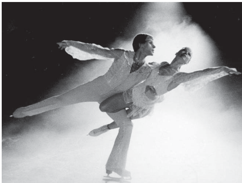
Двукратные олимпийские чемпионы Людмила Белоусова – Олег Протопопов

История мирового фигурного катания знает много имен американских и российских фигуристов, которые навсегда остались в сердцах болельщиков обеих стран. Старшему поколению россиян хорошо известны такие американские мастера голубого льда, как двукратный олимпийский чемпион Дик Баттон (Richard Totten «Dick» Button), названный в 1999 году лучшим фигуристом столетия 8 ;