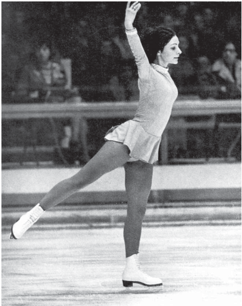
Пегги Флеминг, олимпийская чемпионка 1968 года. Фото из альбома «Olympische Winterspiele Grenoble 1968». Sportverlag, Berlin, 1968. P. 95.

Так, в фигурном катании на коньках появился новый стиль, который впоследствии станет международным. Его основатель умер от туберкулеза в 1879 году в небольшой финской деревушке Гамла-Карлеби (Gamla-Karleby). Фигурист прожил довольно короткую, но яркую жизнь. На его могиле сохранилась надпись, не требующая перевода: «The American Skating King» 6 .